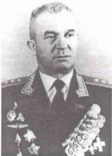
Генерал-полковник Ф. И. Добыш

После образования Ракетных войск стратегического назначения в декабре 1959 года как вида Вооруженных Сил СССР они состояли из двух ракетных армий в городах Смоленск и Винница и семи отдельных ракетных корпусов в городах Владимир, Киров, Оренбург, Джамбул, Омск, Чита и Хабаровск, а затем после 1970 года в РВСН стало шесть ракетных армий в городах Смоленск, Винница, Владимир, Оренбург, Омск и Чита.