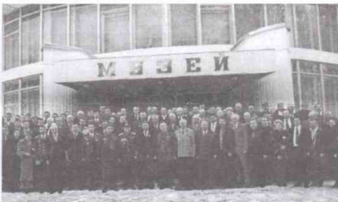
Участники встречи 10.12.2005 г.