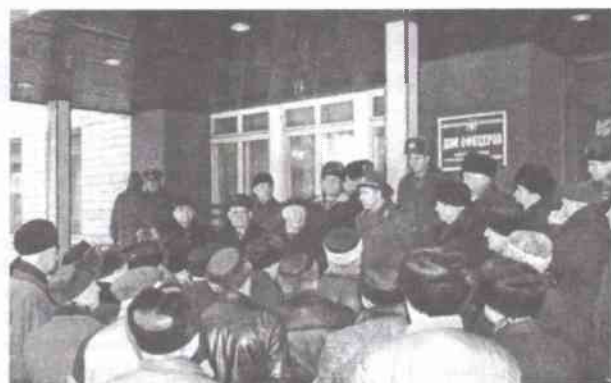
Встреча делегации Московского Комитета ветеранов войны

В активе Московской городской организации ветеранов РВСН на общественных началах трудится более 750 человек.