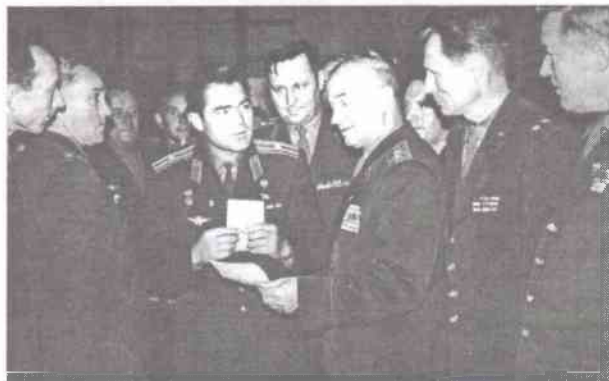
Встреча с космонавтом А. Николаевым

Командующим армией проводятся серии опытных учений с ракетными дивизиями. Лучшие ракетные полки армии были удостоены высокой чести представить Ракетные войска на военных парадах городов Москва и Ленинград (637 рп г. Таураге и 303 рп г. Кингисепп). Серьезным критерием реальной боеспособности для ракет-