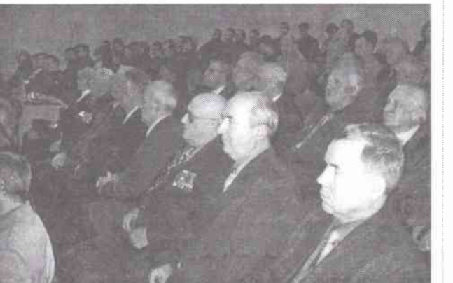
Первопроходцы 35 рд