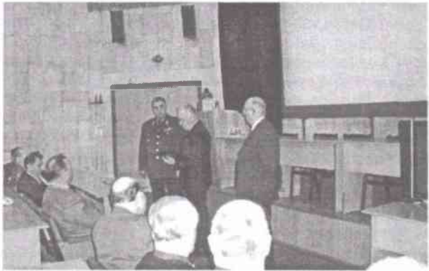
Вручение приветственного адреса генерал-лейтенанту С. В. Хуторцеву

В настоящее время председатели советов первичных ветеранских организаций 1926–1936 гг. рождения составляют основу ветеранского актива. Почти 40% – это люди в возрасте 70 и более лет. Но дело не в процентном соотношении. Важно иметь дееспособные кадры. Понятно, что в силу тако-