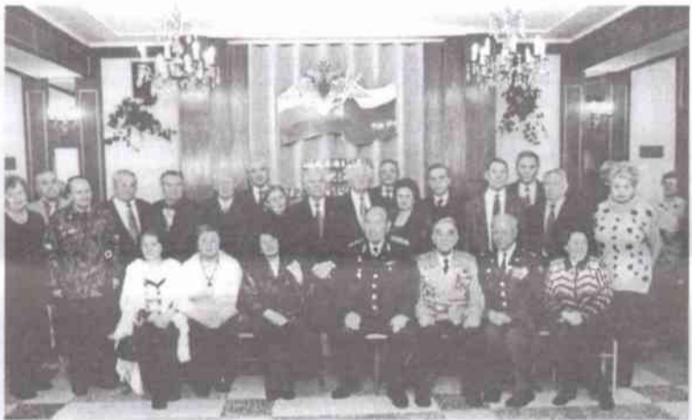
На память о встрече 4.02.2006 г., Власиха