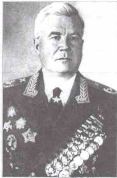
Первый Главком РВСН, главный маршал артиллерии М. И. Неделин

Наша бригада после пятилетнего пребывания на полигоне Капустин Яр осенью 1952 года была передислоцирована в с. Медведь Новгородской области. В январе 1953 года по приказу из Москвы 2-й дивизион (командир – прекрасный организатор, опытный ра-