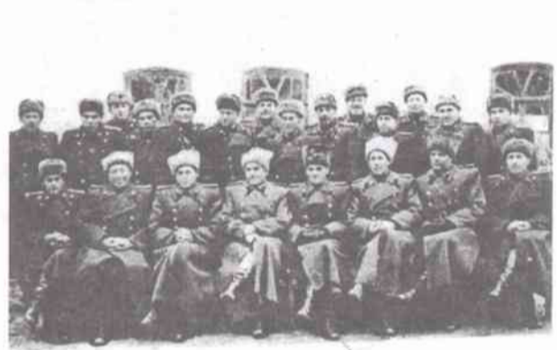
Управление 23 БОД

29 октября 1952 года в 15 часов 45 минут 7-я огневая батарея и 9-я техническая батарея 3-го дивизиона произвели первый пуск ракеты Р-1 № 420 с оценкой «хорошо».