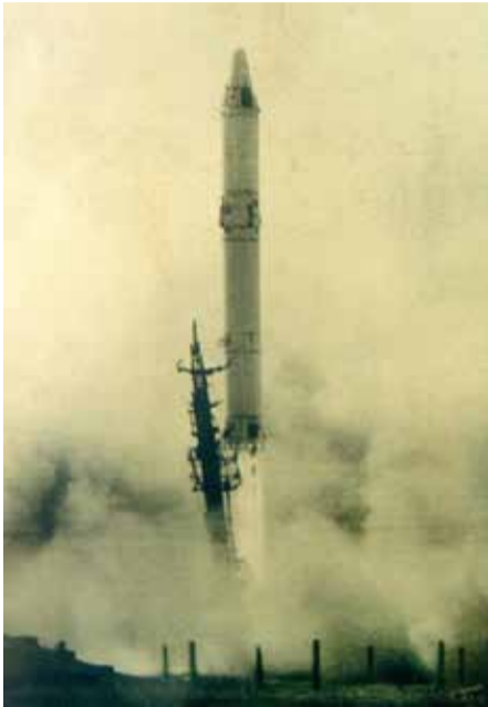
Советский стратегический ракетный комплекс на базе МБР Р-36, оснащенный баллистическими ракетами с орбитальной головной частью Р-36орб (8К69)

К концу 1950-х годов в США были широко развернуты работы по созданию твердотопливной МБР «Минитмен» наземного базирования в шахтной пусковой установке и твердотопливной ракеты «Поларис» для подводных лодок.