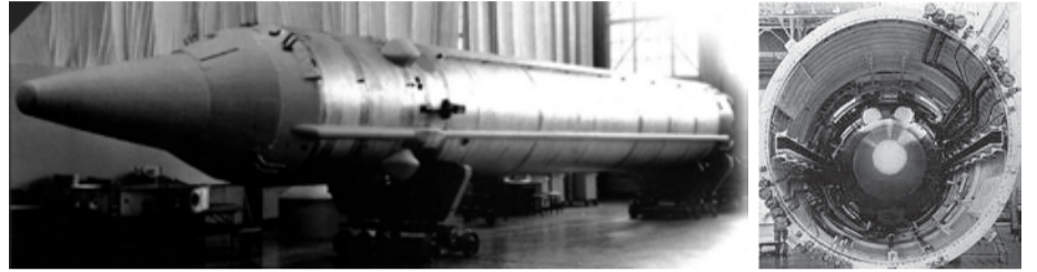
Советская жидкостная двухступенчатая межконтинентальная баллистическая ракета шахтного базирования УР-100 (8К84)

Ракетные войска стратегического назначения успешно выполняют планы разработки и создания нового поколения межконтинентальных ракет Р-36 и УР-100, определенных Постановлениями ЦК КПСС и Совета Министров СССР.