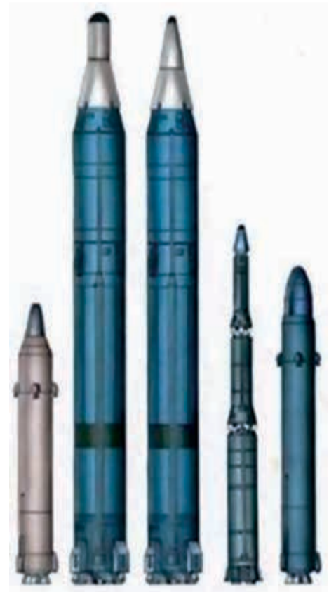
Ракетные комплексы второго поколения. Слева направо: УР-100, Р-36, Р-36орб, РТ-2, УР-100К

Ракетные войска стратегического назначения стали главной составляющей стратегических ядерных сил страны и внесли весомый вклад в достижение стратегического паритета между СССР и США в начале 70-х годов XX века.