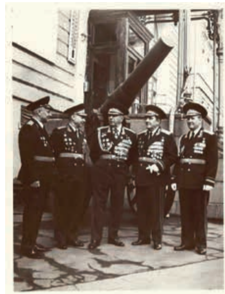
40 лет Великой Победы, май 1985 года