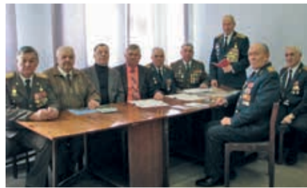
На заседании совета

труда, Вооруженных сил и правоохранительных органов. На собрании активно обсуждалось состояние дел в организации, высказывались критические замечания и принято решение по дальнейшей работе. Избраны – председатель, ревизор и состав Совета ветеранов.