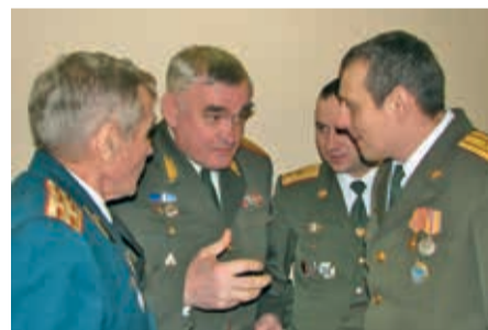
Рассказы ветеранов всегда интересны