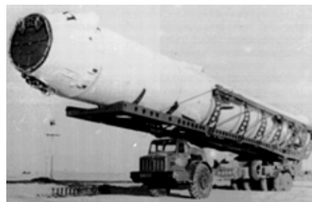
Стратегический ракетный комплекс с ракетой тяжелого класса Р-36 (8К67), способной нести термоядерный заряд и преодолевать мощную систему ПРО противника