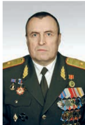
генерал-майор СЕЛЮНИН Анатолий Семёнович 2014-н/в

Более четверти века Союз ветеранов-ракетчиков ведет свою деятельность на территории Российской Федерации.