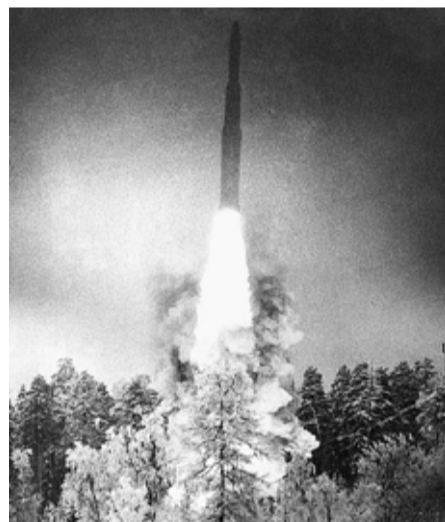
Первая советская серийная твердотопливная межконтинентальная баллистическая ракета РТ-2 (8К98)

«Тополь», «Тополь-М», «Ярс» и боевой железнодорожный ракетный комплекс.