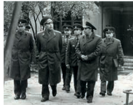
г. Лебедин. 1980 г. В дивизии работает комиссия армии.

торые состояли на её вооружении. Сотни эшелонов с вооружением, боевой техникой и оборудованием были отправлены на арсеналы, базы хранения и ликвидации. Части и подразделения дивизии, по мере снятия с боевого дежурства, переводились на новые штаты, одновременно формировались новые части специальных войск и тыла.