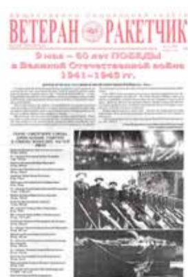
Апрель 2005 года