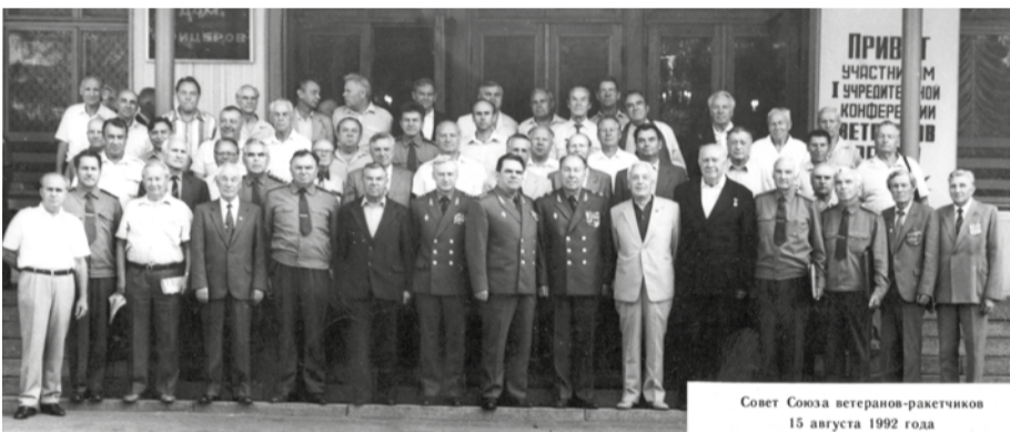
Первый состав Совета ветеранов-ракетчиков. 15 августа 1992 года.

Союз ветеранов-ракетчиков инициировал разработку и утверждение Главкомандующим РВСН «Комплексной программы совместной работы Главного командования РВСН и Совета СВР по социальной защите уволенных и уволь-