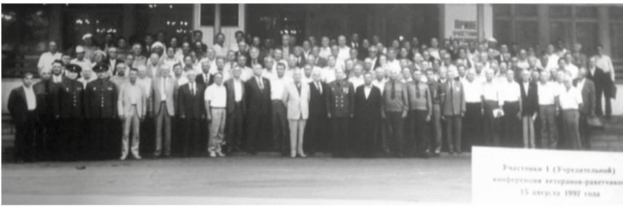
Участники 1-й (Учредительной) конференции 15 августа 1992 года, Дом офицеров РВСН, г. Одинцово-10

Ход конференции освещался корреспондентами газеты «Красная Звезда», журнала «Человек и космос», радиостанцией «Маяк» и др.