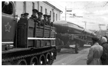
Крымские «стратеги» впервые едут по Москве 7 ноября 1957 года.

Летом 1956 года бригада участвовала в тактическом учении «Запад». Подразделения соединения были передислоцированы на территорию Казахской ССР, где оборудовали стартовую и техническую позиции и провели пуски ракет Р-2 в сторону полей