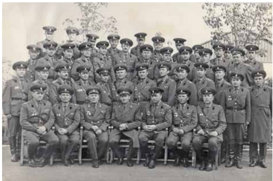
Офицеры управления дивизии с командиром генерал-майором Кадзиловым Б.И.

56 ракетный полк в 56 гвардейский ракетный Феодосийский ордена Суворова полк, 44 ракетный полк в 44 ракетный Слуцкий Краснознаменный ордена Суворова полк.