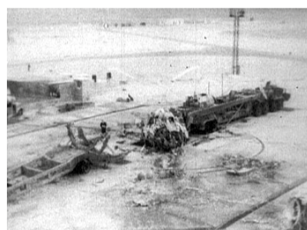
Обломки Р-16 на старте