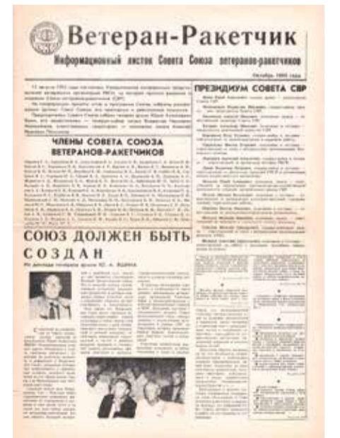
Первый номер Газеты (Информационного листка) Совета ветеранов-ракетчиков «Ветеран-Ракетчик», октябрь 1993 года.

В данной ситуации позитивные результаты стали приносить оперативные рабочие встречи, совещания, телефонные беседы с членами Совета, руководителями региональных и местных организаций Со-