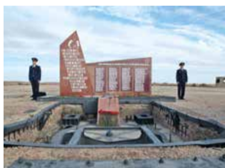
Памятник испытателям ракетной техники на Байконуре

Первый главнокомандующий Ракетными войсками стратегического назначения Главный маршал артиллерии Митрофан Иванович Неделин непосредственно занимался разработкой, созданием и осна-