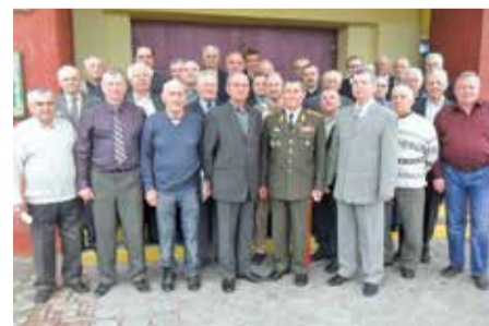
Участники учредительного собрания, 16 апреля 2018 года, г. Лида