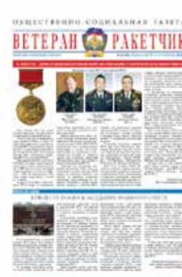
Август 2018 года