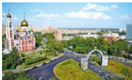
Вид города Одинцово с высоты птичьего полета. 2019 год.