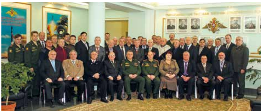
2-е совещание ветеранского актива РВСН под руководством командующего РВСН генерал-полковника Каракаева С.В 17 февраля 2015 г.

юза, командованием РВСН, руководителями органов местного самоуправления по решению конкретных повседневных задач ветеранского движения.