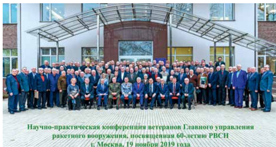
Научно-практическая конференция ветеранов Главного управления ракетного вооружения, посвященная 60-летию РВСН г. Москва, 19 ноября 2019 года

Учитывая многочисленность первичной ветеранской организации Главного управления ракетного вооружения и невозможность охвата всех ветеранов организации в мероприятиях, проводимых Командованием РВСН в ознаменование 60-летия Ракетных войск стратегического назначения, Советом ветеранов ГУРВО было принято решение провести 19 ноября 2019 года научно-практическую конференцию, посвященную юбилею РВСН, в день, прежде определенный как День рождения ракетных войск и артиллерии и Ракетных войск стратегического назначения.