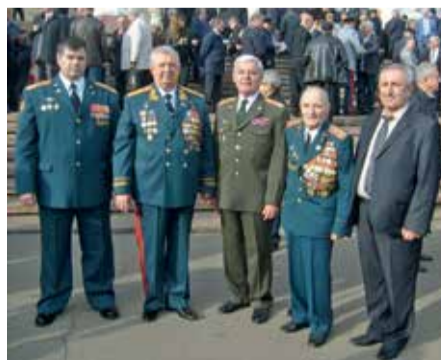
Ветераны-связисты РВСН в ЦАТРА на торжествах, посвященных 100-летию войск связи ВС РФ.

Открытие памятника прошло при построении личного состава отдела связи,