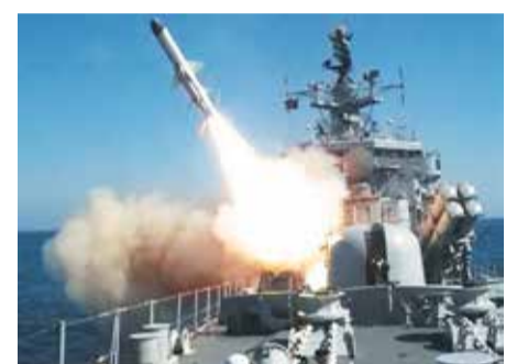
Крылатая ракета морского базирования «Калибр»