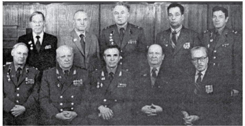
Ветераны-фронтовики в расположении Инженерной службы РВСН