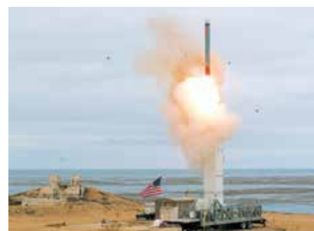
Наземный вариант крылатой ракеты США «Томагавк»

Эксперты России считают, что следующим шагом Вашингтона будет установка пусковой системы на колесное шасси. Тогда «Томагавки» станут еще большей угрозой для России. Глава Пентагона выдвинул России ультиматум: хотите мира – готовьте к утилизации свои «Калибры», «Буревестники» и «Кинжалы». Стало очевидным