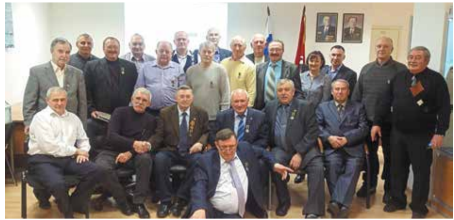
Группа однокурсников в Москве, 2019 год

Собравшиеся в Москве и в Ростове-на-Дону однокурсники почтили память