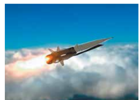
Гиперзвуковая противокорабельная крылатая ракета «Циркон»

требование по одностороннему разоружению, и если и дальше так дело пойдет, то и СНВ-3 ждет судьба ДРСМД.