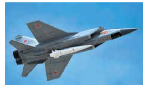
Гиперзвуковая ракета «Кинжал»