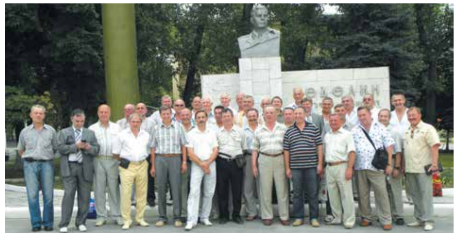
Группа однокурсников в Ростове-на-Дону, 2010 год

Каждому однокурснику была вручена памятная медаль «60 лет РВСН», размноженные экземпляры газеты «Ветеран-ра-