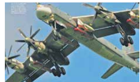
Крылатые ракеты Х-101