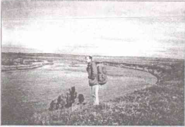
У реки Озерная

В начале 1957 года получаем распоряжение – «готовить поисковые группы» с выходом в «поле».