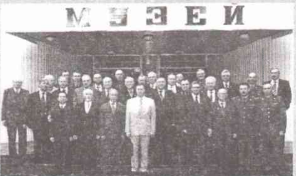
Участники патриотической акции