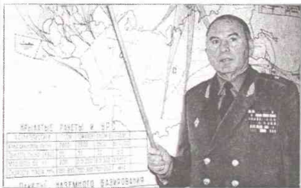
Рассказ о войне

Молодого, образованного, обогащенного огромным боевым опытом офицера было решено направить на главное направление развития Вооруженных Сил в условиях мирного времени – на подготовку новых поколений защитников Оте-