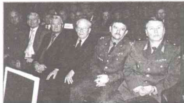
...С большим вниманием