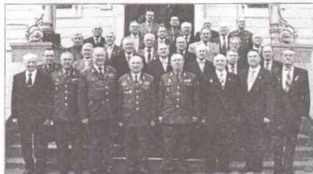
Делегаты от Центрального аппарата