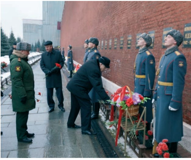
Ветераны РВСН возлагают цветы к месту захоронения первого Главкома РВСН Главного маршала артиллерии Неделина М.И.

Неделин», «За службу в РВСН», «За боевое дежурство в РВСН» и др. Многие ветераны награждены «Золотым Знаком Союза ветеранов РВСН», медалями и знаками Общероссийской общественной организации ветеранов Вооруженных Сил Российской Федерации, Правительства Москвы и Московской области, отмечены Почетными грамотами, Благодарственными письмами и Благодарностями Объединения. Некоторые имена ветеранов-ракетчиков занесены в энциклопедию «Лучшие люди России».