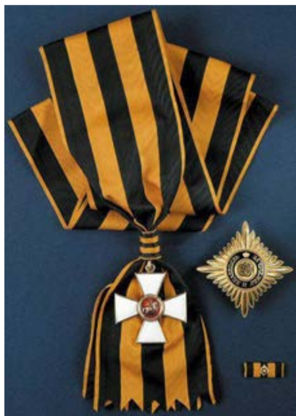
Внешний вид Ордена Святого Георгия I степени

четырёх степеней, среди которых великие русские полководцы: М.И. Кутузов и М.Б. Барклай-де-Толли.