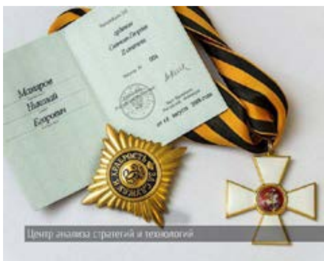
Орден с наградной книжкой